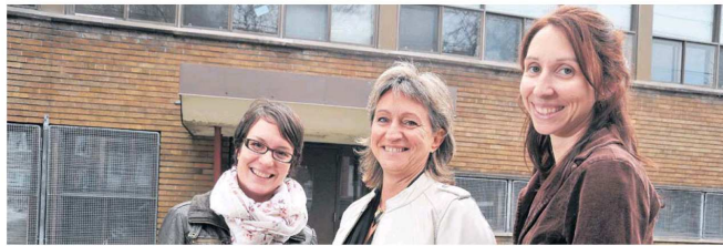
Escale Famille Le Triolet prévoit construire un nouveau bâtiment d'une trentaine de logements en lieu et place de l'école située au 6910, avenue Pierre-De-Coubertin.

En juin 2016, Escale Famille Le Triolet doit avoir quitté les locaux qu'il occupe présentement. N'ayant pas trouvé à se reloger, l'organisme a décidé de construire un bâtiment de trois étages, qui comprendra une trentaine de logements sociaux destinés aux mères monoparentales.